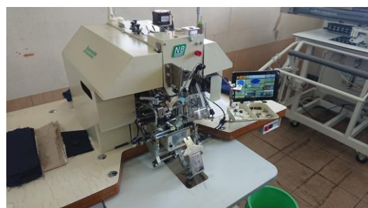
NB7000V 新型根巻きボタン付けミシン