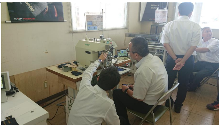
新型根巻きボタン付けミシンの新機構に興味津々のお客様