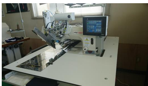
AMF Reece S39 玉縁自動機