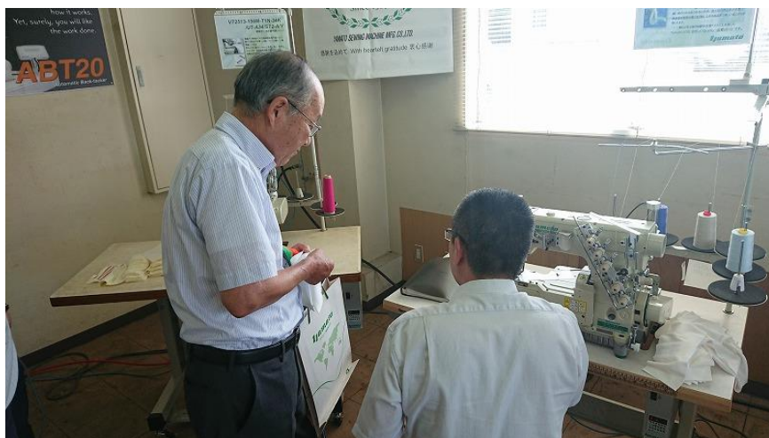
ほつれ防止機能付き糸切装置 UTQ への反応も上々