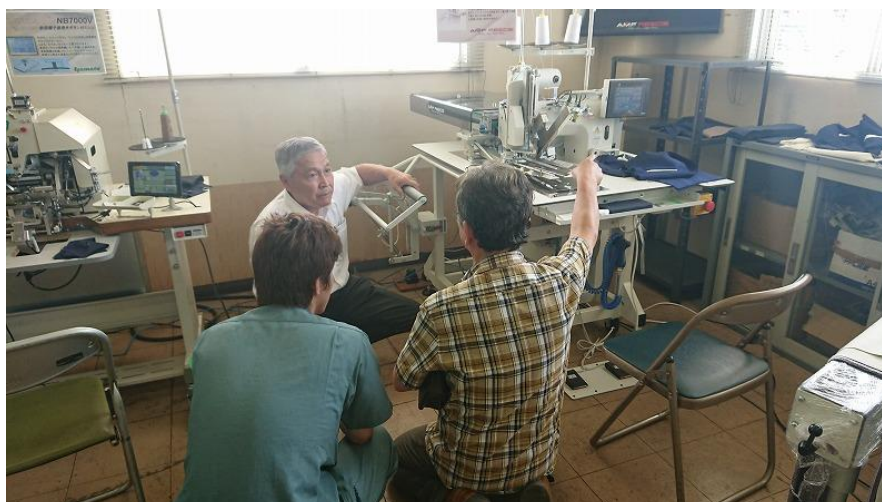
AMF 新型玉縁自動機 S39 の説明にも力が入ります