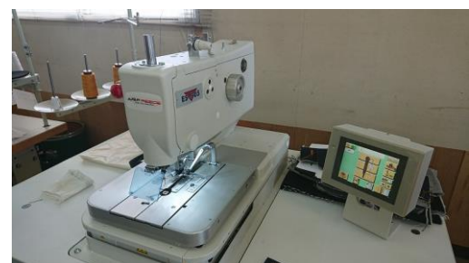
AMF Reece S505 鳩目穴かがりミシン