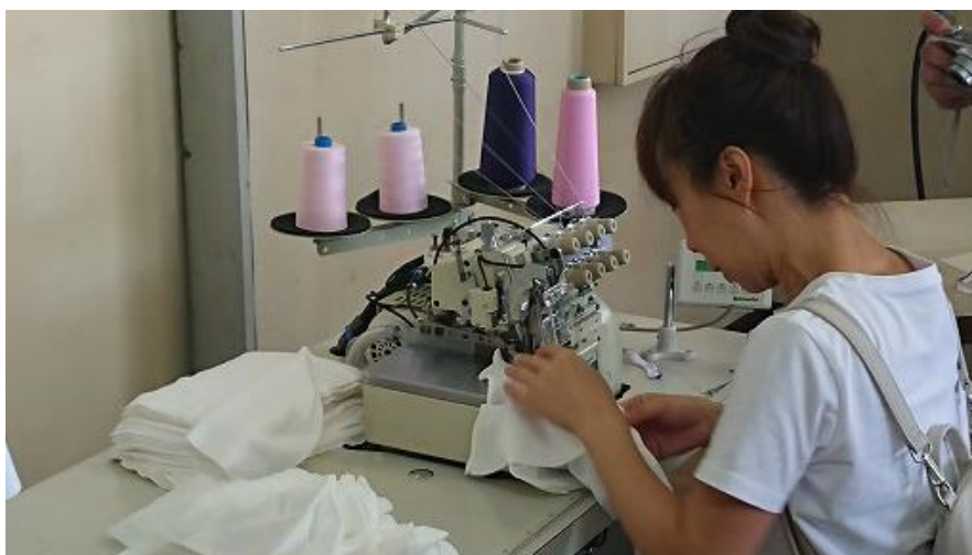
製品をお持ちになり弊社機の縫い調子を試されるお客様も