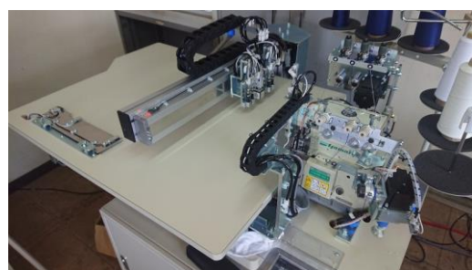
オートランナー ハンカチ縁縫い自動機