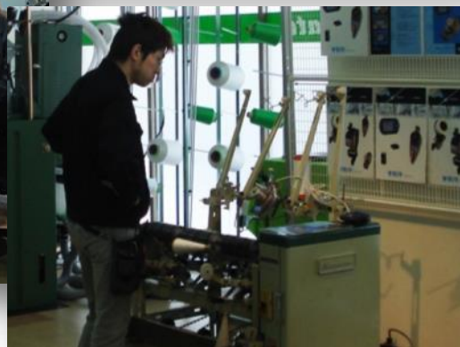
BTR を使用したワインダー装置も